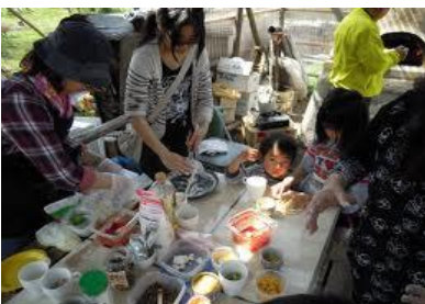
今では仲間も増えました