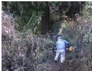
一人で笹と格闘していた頃...