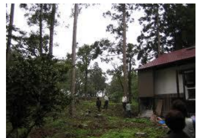
どうにか光が入るようになった頃