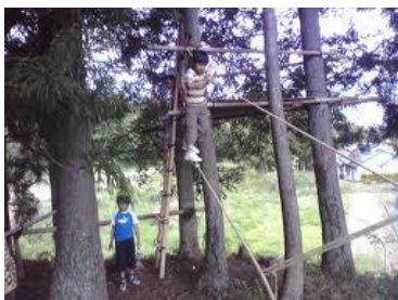
子供の遊び場も出来ました