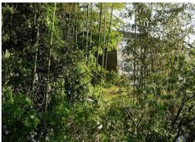
活動開始前の荒れてしまった屋敷林

現在、在住の東京都練馬区にて、維持管理が難しくなった屋敷林などを「みんなの自然の遊び場」として活用させていただき活動をしています。もともとは近所のお宅の裏庭があまりにも荒れていたの、運動不足解消にもなるしと管理をちょっとだけ手伝いましょうかと個人で始めました。しかし、やはり屋敷林を一人で維持管理することはかなり大変となり、屋敷林の持ち主さんのご意向や行政などにも相談しNPOを立ち上げました。会の発足当初は私の経験不足からいろいろ大変なことがあり、何度も活動を中断しようかと思いました。しかし、こういう時こそ同じ活動をされている先輩方に相談したいと、先方のご迷惑を顧みず、近隣の環境再生医の方をご紹介いただき、貴重なアドバイスをたくさんいただきました。また、今でも新しい現場ができた際には留意点などを教えていただくなど、本当に心強い相談相手となっていていただいています。活動も6年目となり、今では市民の方はもとより、保育士さんや造園業の方など、プロの方にも協働いただけるようになってきました。しかし環境保全活動の課題には終わりはなく、また常に勉強が必要だと感じる日々です。いつか自分も他の環境活動者にアドバイスができるような実力をつけたいと思い、上級取得まで活動を続けながら自己研鑽を続けたいと思っています。