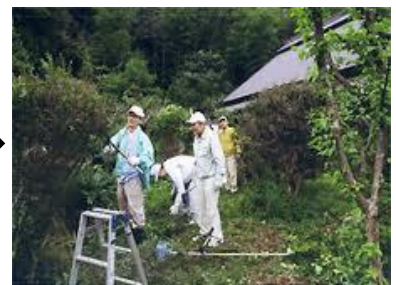
環境再生医の先輩に貴重なアドバイスをいただいているところ